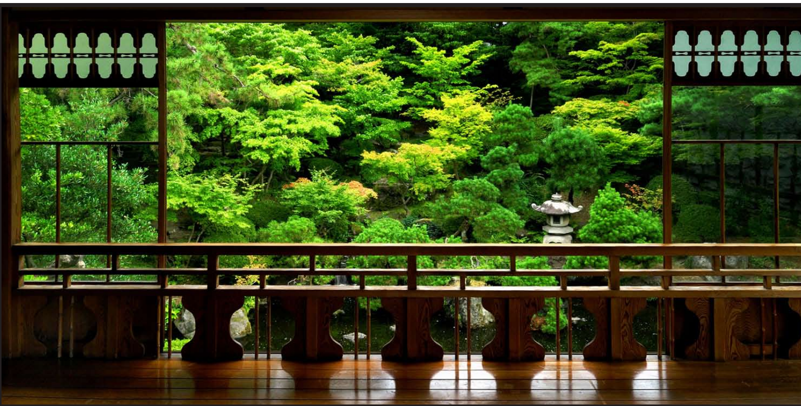
【2階「観月亭」より庭を望む】